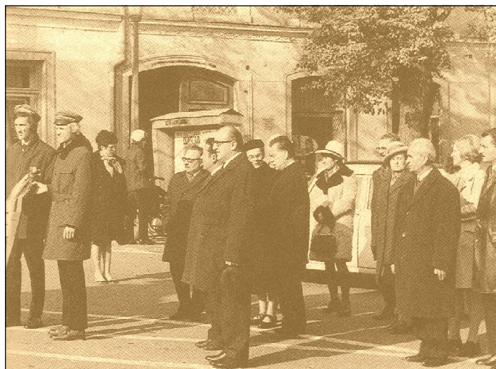
Koszorúzás előtt az újhelyi főtéren az első verseny alkalmából